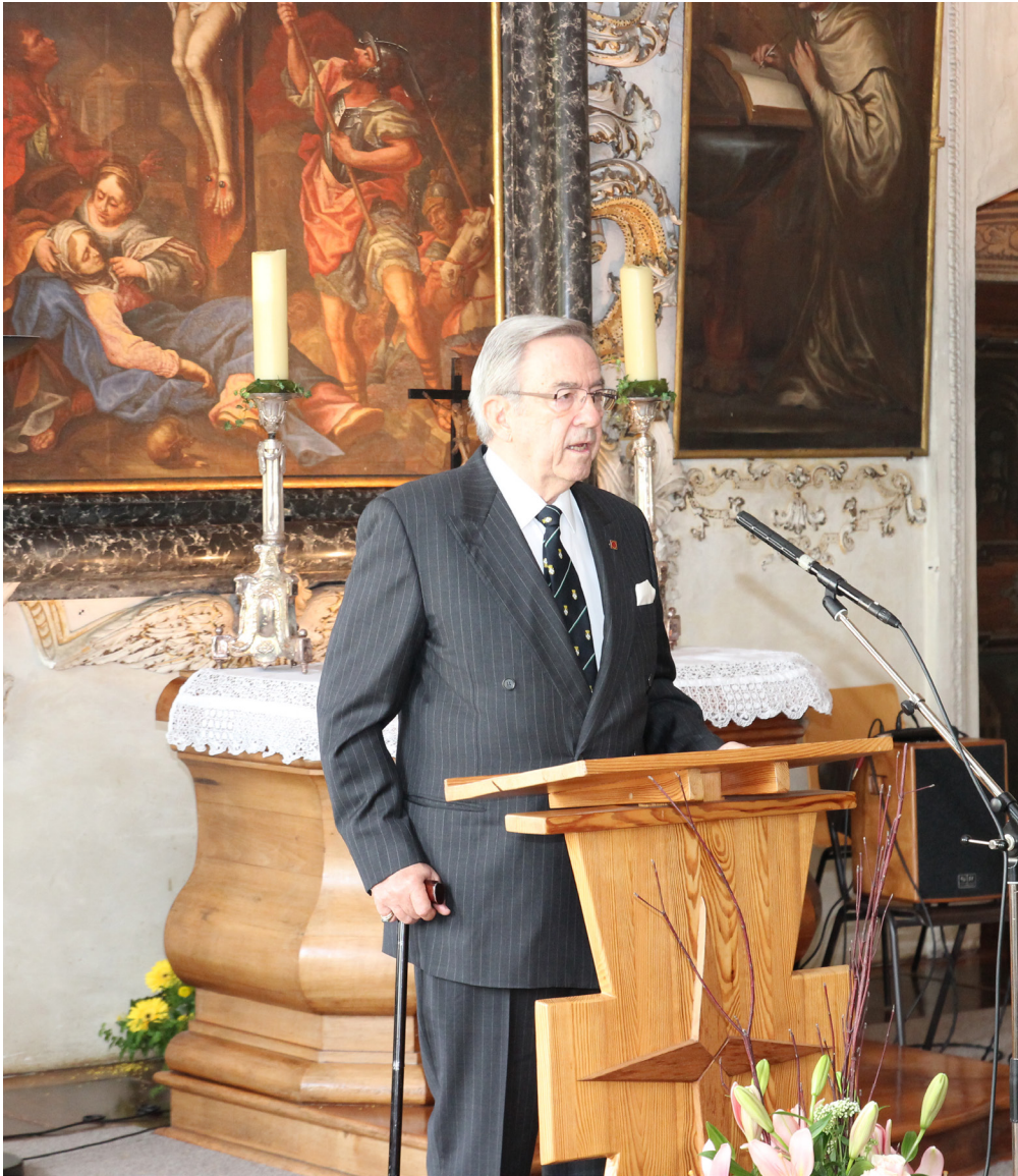
SM König Konstantin von Griechenland HM King Constantine of Greece